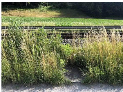
Kontrollschacht innerhalb Gefahrenbereich Gleise