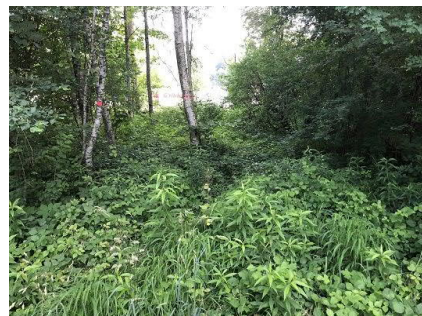
Schachtbauwerke - suchen bis gefunden