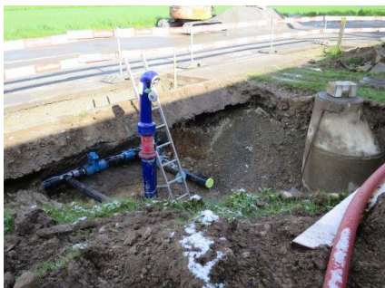
Abgang Ringleitung und Hydrant