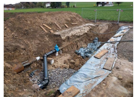
Etagierung der bestehenden Leitung auf die neue Bahnunterquerung