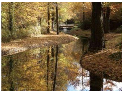
Hardwald mit Versickerungsgraben