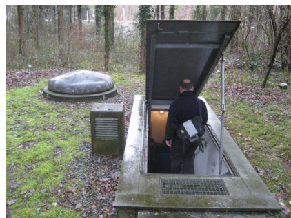
Eingang zu Unterflur-Grundwasserpumpwerk