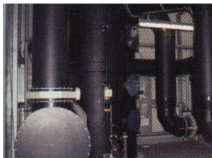
Luftwäscher und Rohranlagen beim Abluft-Biofilter