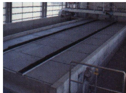
Überdeckter Sand- und Fettfang