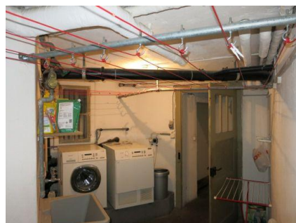
verschiedenste Entwässerungsgegenstände und Abwasserquellen, im Untergeschoss