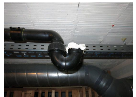
unsachgemässes Verschliessen von nicht mehr benötigten Leitungen