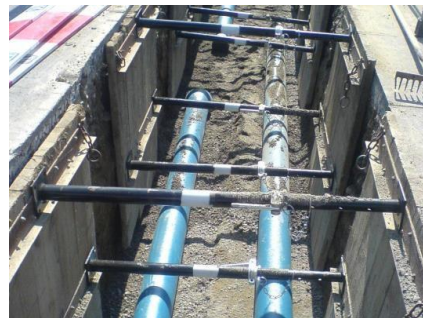
Duktile Guss-Leitungen, eingebettet in Betonkies