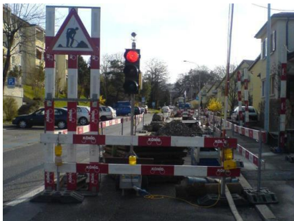
Die Sicherheitsvorkehrungen sind oberstes Gebot der Bauleitung