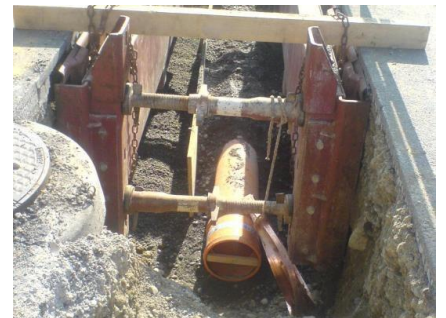
Schmutzabwasserleitung, eingebettet in Sohlen- und Hüllbeton