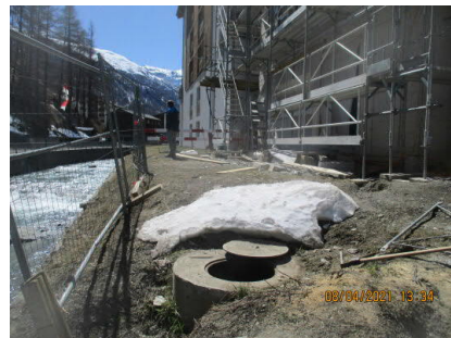
Überprüfung der Nutzungsart auf dem Feld