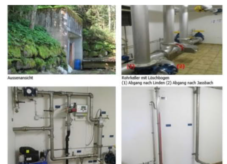
Foto- und Anlagedokumentation