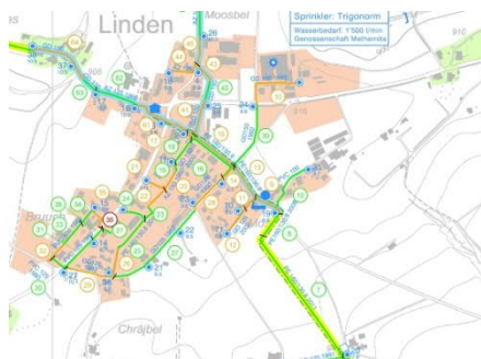
Plan Wiederbeschaffungswerte mit bewerteten Leitungen